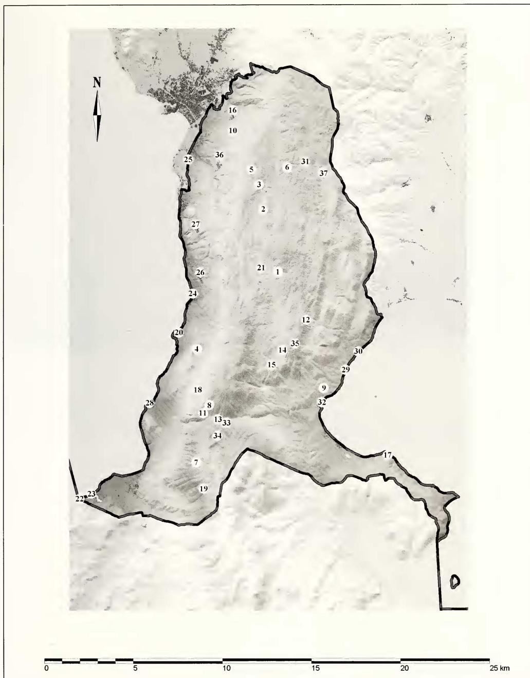
Fig. 3. Localities referenced.

Konjski Merizi, Zdravec, 25.06.2009, P. Jakšić; Galičica Mt.: Asandura (Šarboica), 26.06.2009, M. Ivanov; Galičica Mt.: Glajša, 27.06.2009, 1000 m, V. Krpač; Oteševo: Grnčarska Kolonija, 28.06.2009, V. Krpač; Galičica Mt.: Tri Bora, 28.06.2009, V. Krpač; Galičica Mt.: v. Stenje to v. Konjsko, 28.06.2009, V. Krpač.